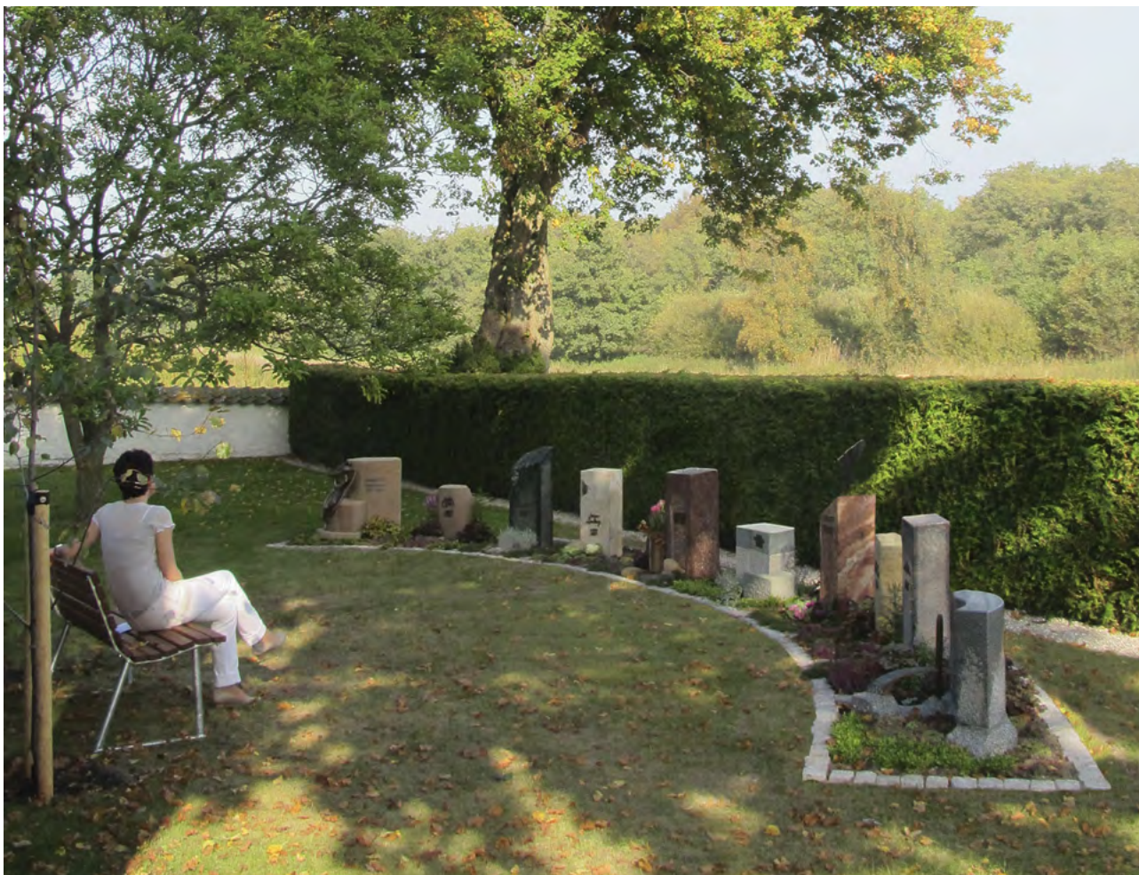
Det intime rum er bevaret. Plads til individuel udformning af grav. Et sted at sidde ned