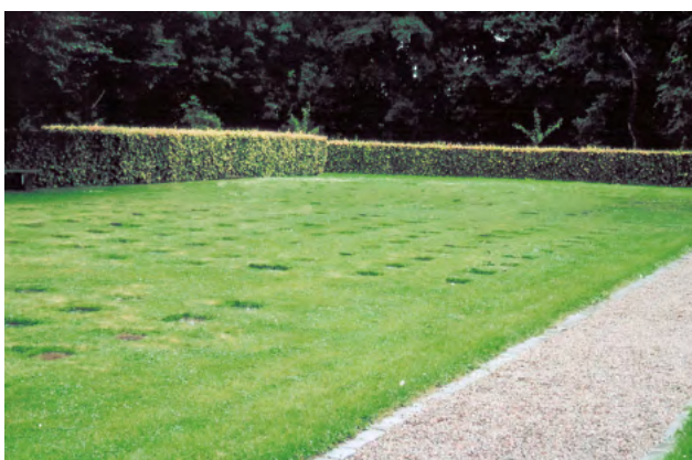
Når det intime rum mangler